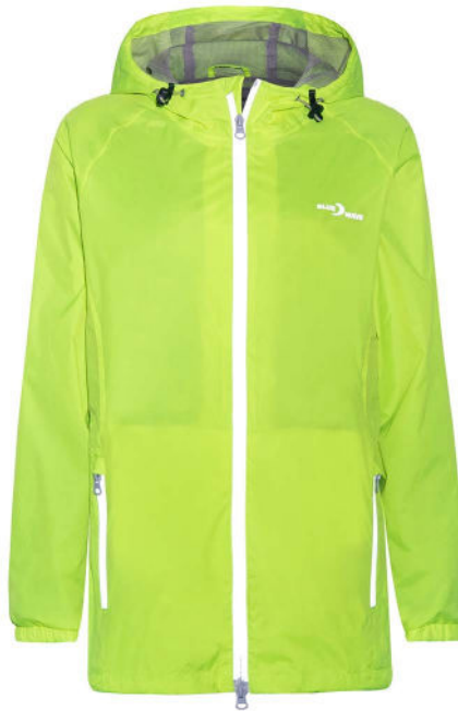
137 new neongelb