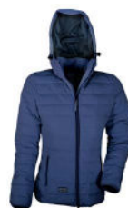
41 blue nights