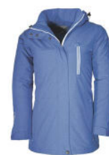
43 steel blue