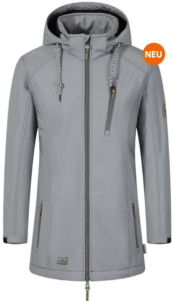
09 schwarz melange