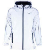
32 silver reflective