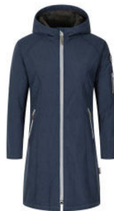
09 schwarz 41 blue nights