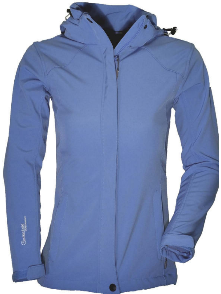
43 steel blue