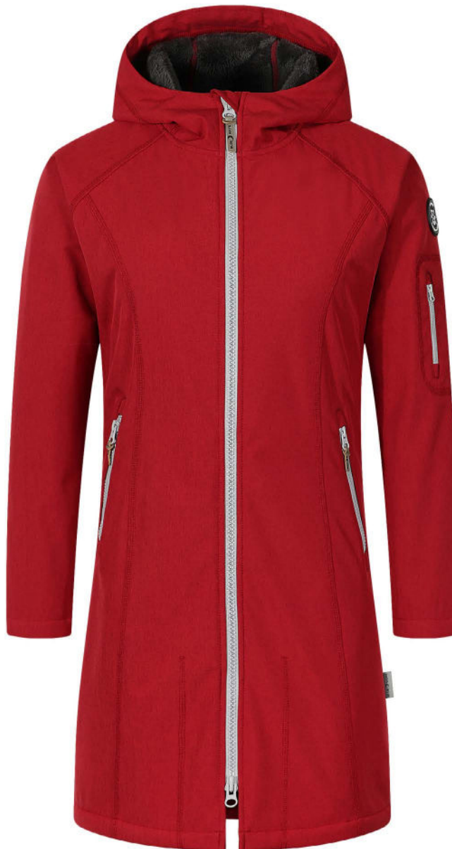
53 granat rot