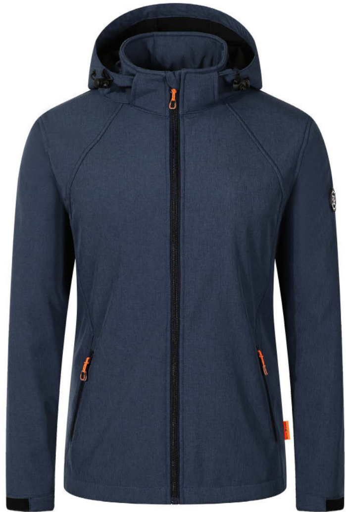
41 blue nights