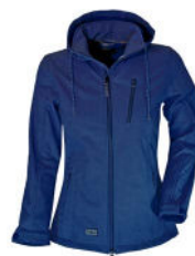
41 blue nights