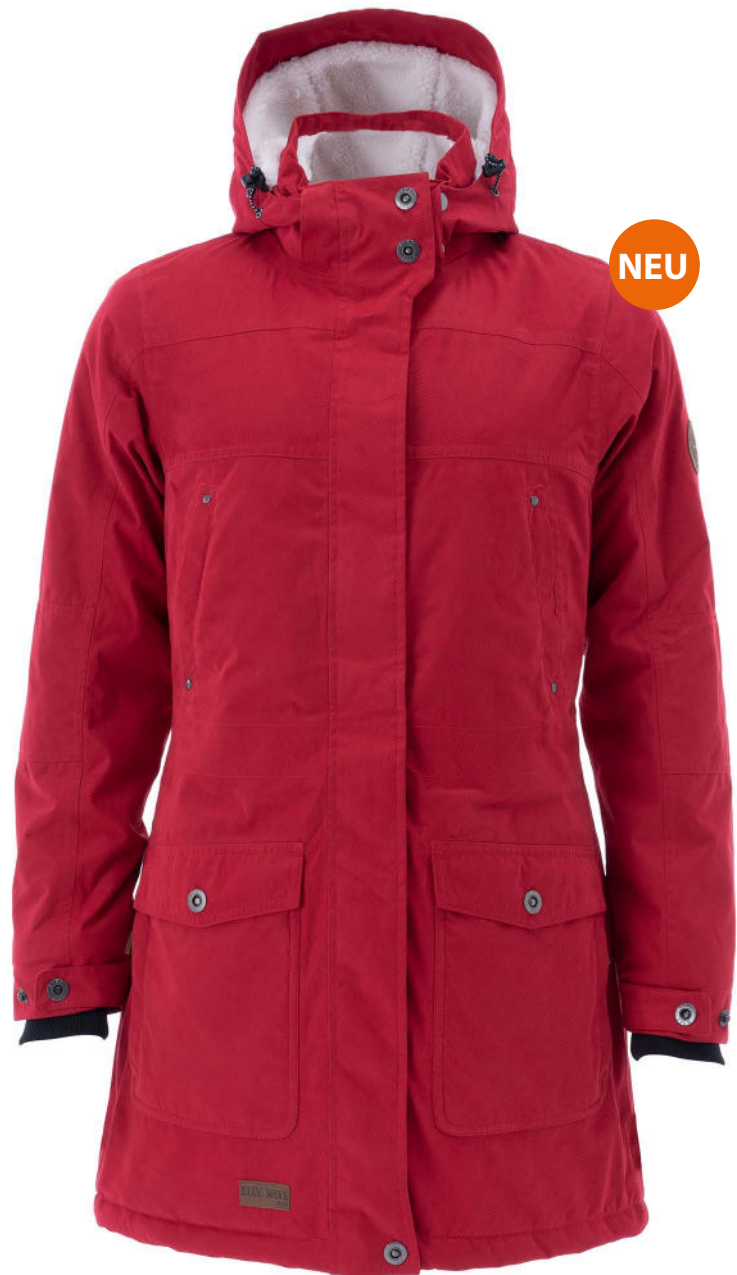
53 granat rot