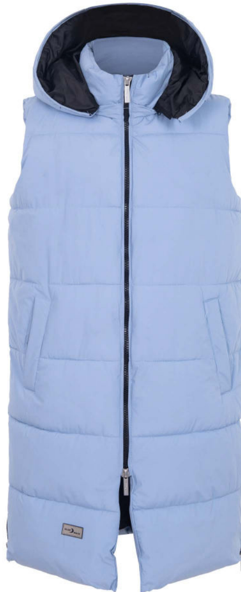
43 steel blue