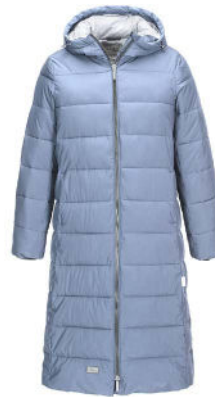
43 steel blue