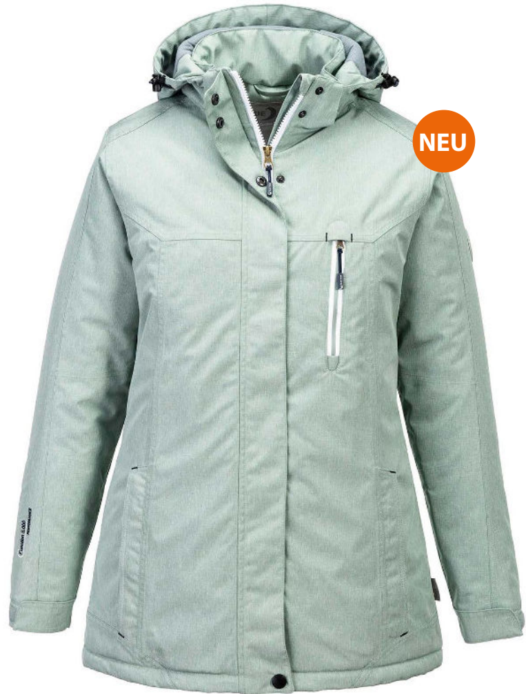
50 seagrass melange